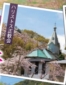
ハリストス正教会

温泉街を散策しながら「桜めぐり」 修善寺寒桜が3月中旬から見頃を迎え、他にも開花時期の遅い八重桜なども随所で楽しめます。